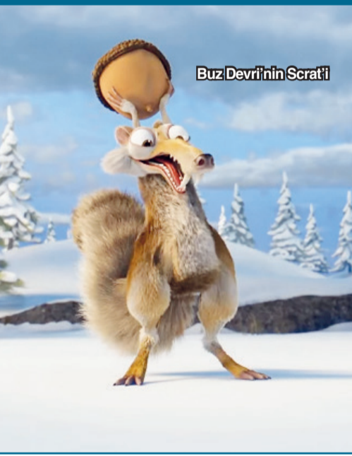
Buz Devri'nin Scrat'i